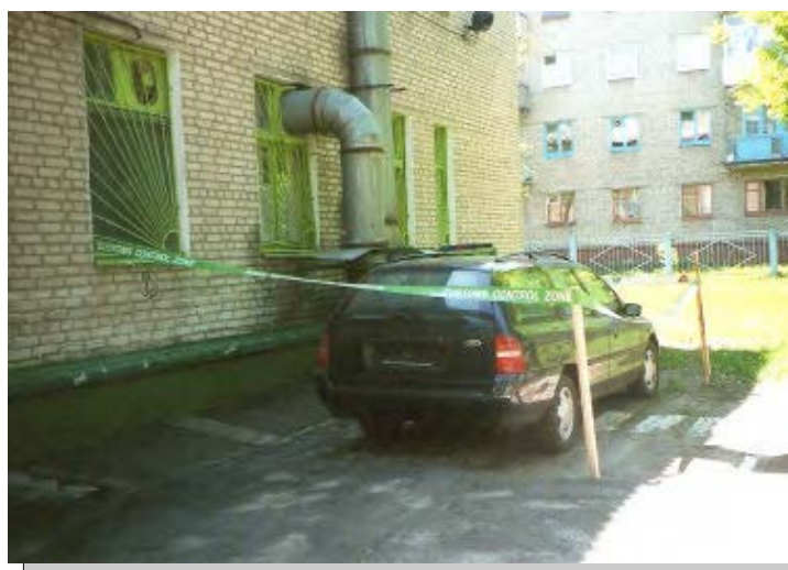
Der von uns gespendete und überführte Ford-Mondeo steht bis zur Zollfreigabe unter einem provisorischen aber amtlichen Zollverschluss neben dem Sozialpädagogischen Zentrum in Mogilev

Ladepapiere so viel Zeit in Anspruch nehmen muss.