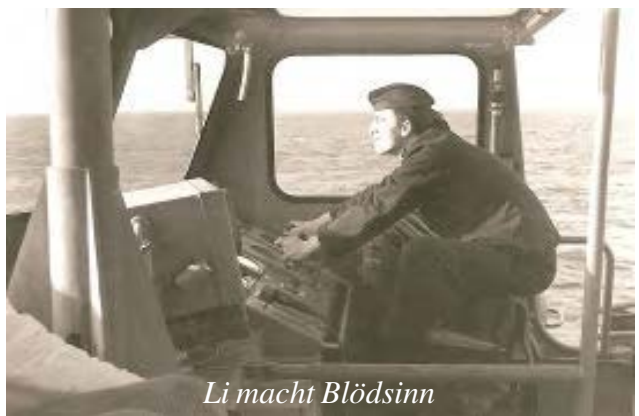
Li macht Blödsinn

Es wurde manches auch bei uns nicht so todernst genommen. Immer nur den „Klassenkampfauftrag“ im Kopf; Wer hält das schon aus?