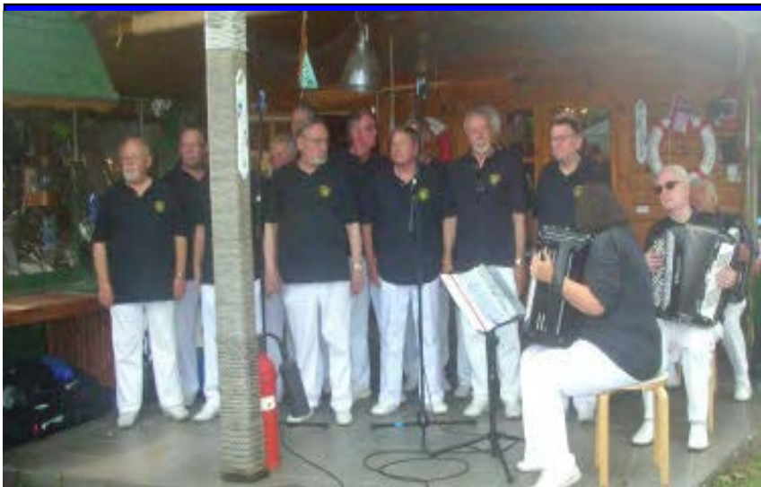
Der Shantychor Berlin macht den Auftakt und sorgte für gute Stimmung

Lag es daran, dass diesmal der Schifferpfarrer nicht anwesend war oder sollten alle auf Wasserfestigkeit geprüft werden; denn urplötzlich verdunkelte sich der Himmel und es goss wie aus Ei