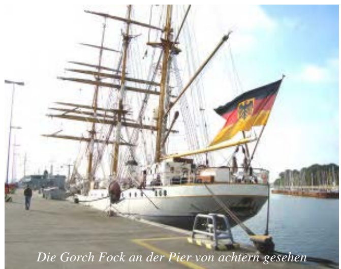
Die Gorch Fock an der Pier von achtern gesehen

Hier wurde nach russischer Art, aufmarschiert und ein Kranz nieder gelegt. Schwerpunktmäßig wurden natürlich die