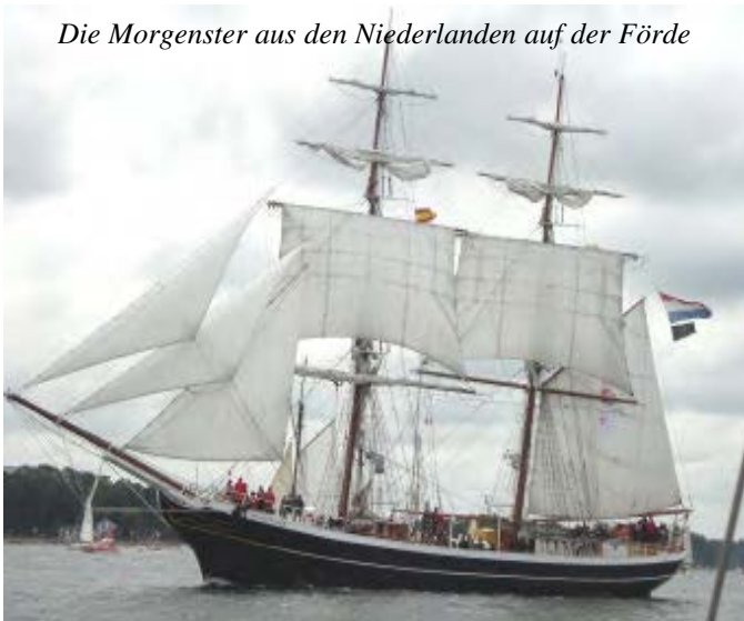
Die Morgenster aus den Niederlanden auf der Förde