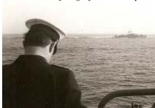
Der „Alte“ fotografiert die Daphne

Bei einer Begleitung der „Daphne“ hat das Fahren im Verband besser geklappt, als mit den Schiffen der eigenen Abteilung!