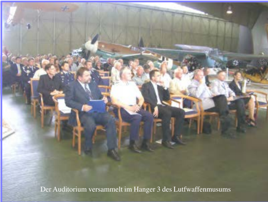
Der Auditorium versammelt im Hanger 3 des Luftwaffenmusums

schen syrischen MiG-21 und israelischen Mirage 111 - findet dann im November 1964 statt. Allerdings verfehlen die Raketen beider Seiten ihre Ziele.