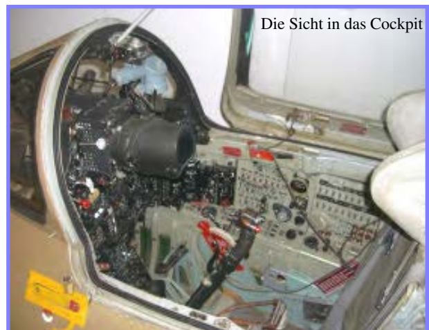
Die Sicht in das Cockpit

Aber natürlich hat man auch bei der „Russischen Luftfahrtvereinigung MiG“ - so der neue Name - die Zeichen der Zeit erkannt, und bietet ein eigenes Modernisierungsprogramm unter Nutzung von Technik und Bewaffnung der MiG-29 an. Im Ergebnis dessen absolvieren 1995 gleich drei „neue“ MiG21-Versionen ihren Erstflug: die MiG-21-93 von RAC MiG, die MiG-21 LanceR von Elbit und Aerostar sowie die MiG-