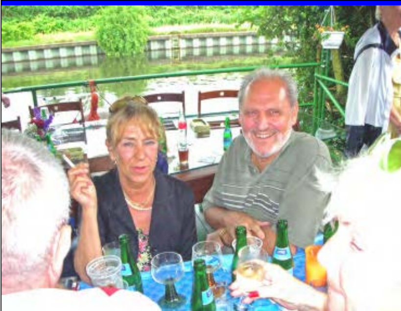
Gute Stimmung am Britzer Zweigkanal bei gutem Essen & Trinken