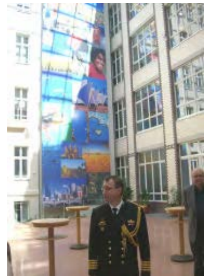
Ein Blick in den Innenhof mit der Wandmalerei

einsätzen, wurden von Kapitän zur See Gavin Irwin umfassend beantwortet. Eine große Erleichterung war dabei für uns, dass er seine Standpunkte sowohl im