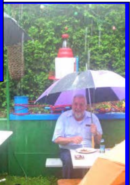
Wie man sieht, Regen kann einem Mariner die Laune nicht verderben