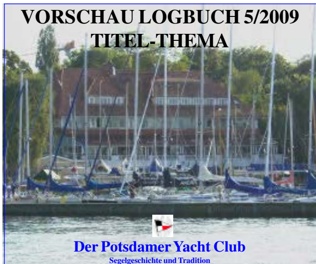
Der Potsdamer Yacht Club Segelgeschichte und Tradition

Sommerfest bei der MK Berlin 1886 e.V. Seite 19