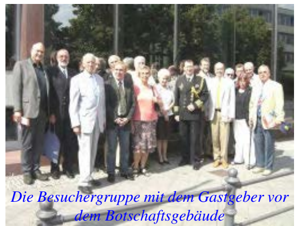
Die Besuchergruppe mit dem Gastgeber vor dem Botschaftsgebäude

überdacht ist. Er lässt sich an die Temperatur der Innenräume angleichen und ist ein Dreh- und Angelpunkt des Gebäudekomplexes. Die phantasievolle Bemalung lässt ihn auch für Veranstaltungen als hervorragend geeignet erscheinen. Den Teilnehmern wird der Besuch noch lange Zeit in guter Erinnerung bleiben.