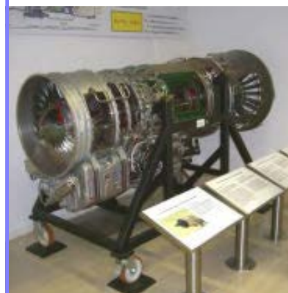
Beim Rundgang zu besichtigende Exponate unten Triebwerk, rechts Reketensätze weitere Ansichten auf der nächsten Seite

lichen Waffenaufhängungen und vergrößertem Kraftstoffvorrat, aber auch mit höherem Gewicht. Auch mit diesen Maschinen gelingt es den Arabern nicht, die Oberhand gegen die israelische Luftwaffe zu gewinnen. Im Jom-Kippur-Krieg von 1973 verhindert nur der massive Einsatz von Fla-Raketen die totale Luftüberlegenheit der Israelis. Selbst die nach Ägypten entsandten sowjetischen MiG-21-Piloten sind dem Gegner nicht gewachsen. Die Vietnamesen wiederum meistern die