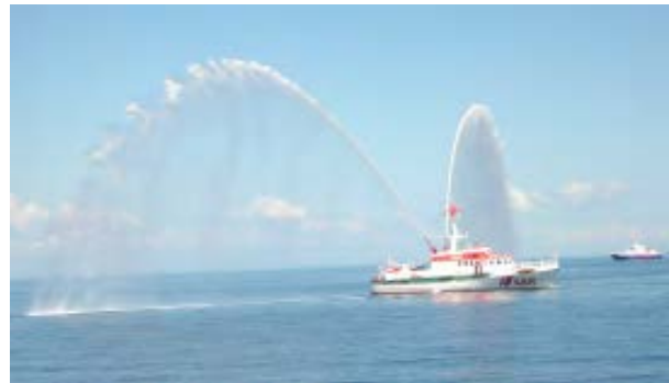
Die in Laboe stationierte Berlin der DGzRS zeigt was sie drauf hat

Die riesigen Fontänen schossen in den Himmel und fielen im Bogen wieder nach unten. Je nach Drehung des Bootes und Stärke des Strahls erschien eine andere Formation.