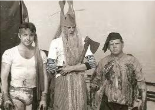
Neptun und Gehilfen