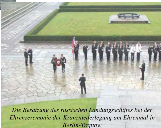
Die Besatzung des russischen Landungsschiffes bei der Ehrenzeremonie der Kranzniederlegung am Ehrenmal in Berlin-Treptow

sehr nette Menschen. Ich habe viel erleben können, und möchte diese Erfahrungen weitergeben, auch mit dem Hintergedanken, dass der ein oder andere Kamerad aus Berlin vielleicht für die Kieler Woche 2010 gewonnen werden kann, und wir als Berliner vielleicht sogar eine eigene Kuttermannschaft zusammenkriegen.