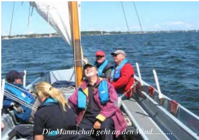
Die Mannschaft geht an den Wind.....

Der Dienstag war der erste Tag um Kiel auch mal bei Tageslicht zu betrachten. Kiel ist die Landeshauptstadt und mit etwa 237.000 Einwohnern größte Stadt