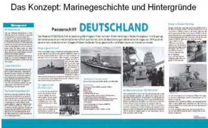
Texttafel DEUTSCHLAND – Neuer Entwurf

Das Konzept: Marinegeschichte und Hintergründe