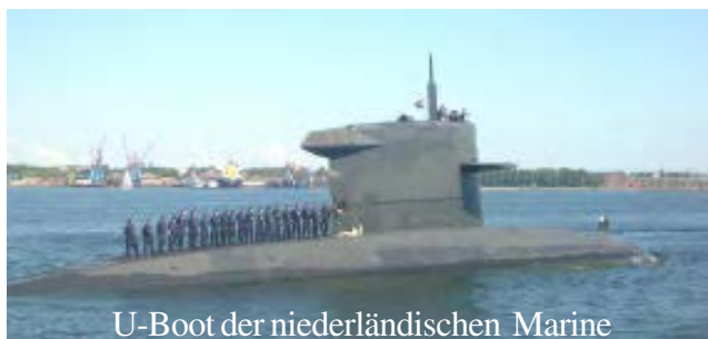
U-Boot der niederländischen Marine

In der Kieler Förde war an diesem Tag keine Regatta, dafür gab es aber genug andere Dinge zu se-