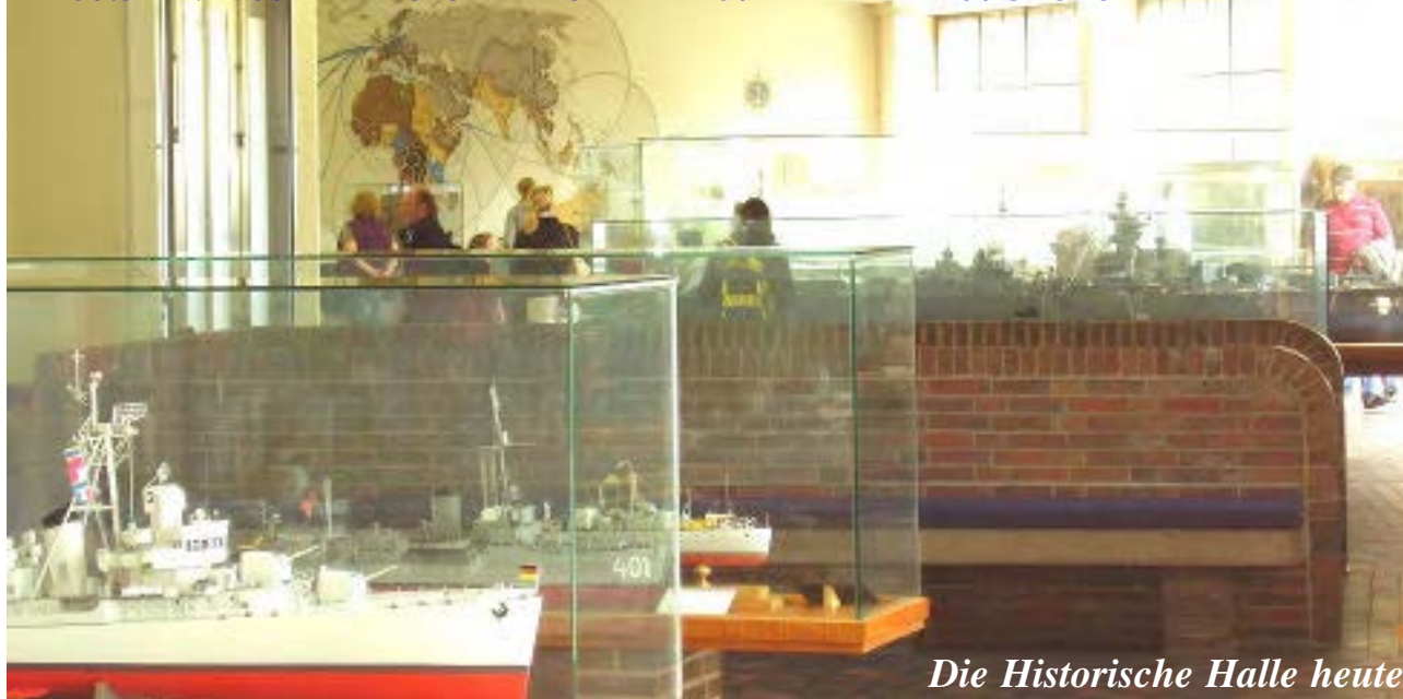
Die Historische Halle heute

Das Marineehrenmal in seiner Historie und Gesamtheit ist einmalig auf dieser Welt. Hier wird Marinegeschichte hautnah verkörpert. Dazu gehört aber auch die Verantwortung gegenüber dem Besucher - insbesondere unserer Jugend - den Zeitgeist zu verfolgen. Dieses setzte und setzt der DMB immer aufs neue um, soweit es die Mittel zulassen. Jetzt ist die Historische Halle an der Reihe, wie der nachfolgenden Bericht von Dr. Witt veranschaulicht.