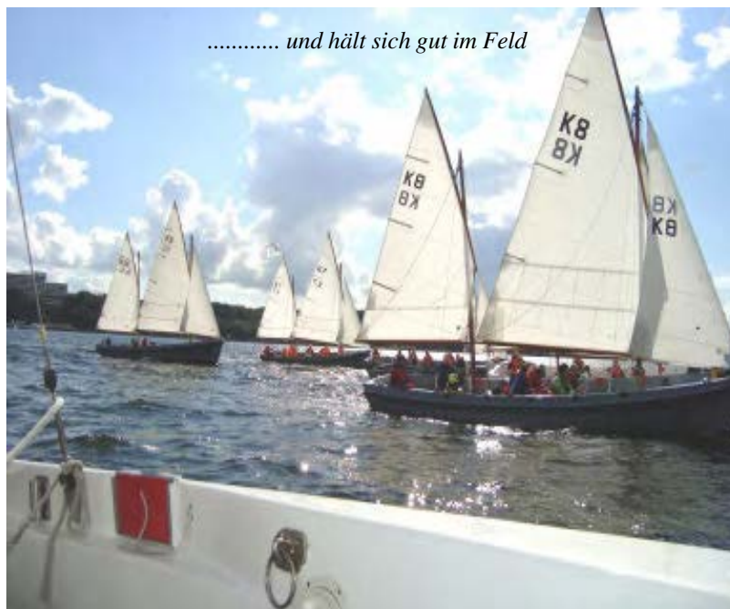
..... und hält sich gut im Feld

tern.....“. Es kam wirklich ab 15:00 Uhr Wind auf, und es wurde eine gute Regatta. Der Montag begann nicht ganz so früh, da die erste Regatta erst um 10:30 Uhr begann. An diesem Tag wurden die Regatten gleich hintereinander gefahren. Da wir zwischen den beiden Rennen eine knappe Stunde Zeit hatten, durfte ich auch mal an die Pin-