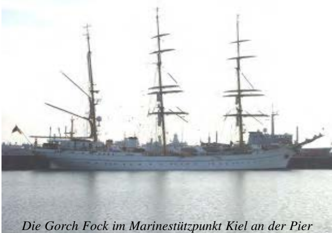
Die Gorch Fock im Marinestützpunkt Kiel an der Pier

Punkte unserer Stadt besichtigt, die die gemeinsame Geschichte zwischen Deutschland und Russland verbindet. Dabei wurden von den Dolmetschern die Ausführungen ins Russische übersetzt.