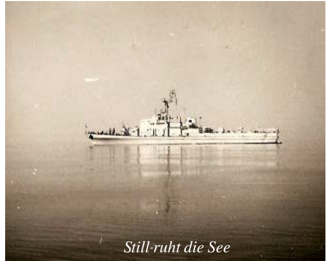
Still-ruht die See

Wenn es die Wetterlage erlaubte und die See war wie ein Spiegel, kam etwas Romantik auf.