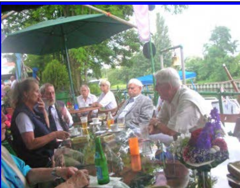
Gute Laune auch bei den Ältesten unter uns - wer macht schon Sonnenschirme zu Regenschirmen? Die Marine!

mern geschüttet. Hier bewiesen alle Anwesenden, dass sie sich durch Wasser nicht aufhalten und sich die Stimmung nicht nehmen lassen. Sie überstanden die fast 2 Stunden fast trocken unter einem riesigen Sonnenschirm oder einer überdachten Sitzgelegenheit.