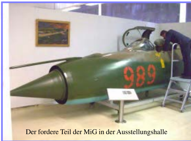
Der vordere Teil der MiG in der Ausstellungshalle

Die Erfolge der Vietnamesen sind es, die die USA veranlassen, über verschlungene Pfade MiG-21 zu beschaffen, die dann von einer streng geheimen Einheit in der Wüste von Nevada geflogen werden, um die Piloten der verschiedenen Teilstreitkräfte mit dem potentiellen Gegner zu konfrontieren.