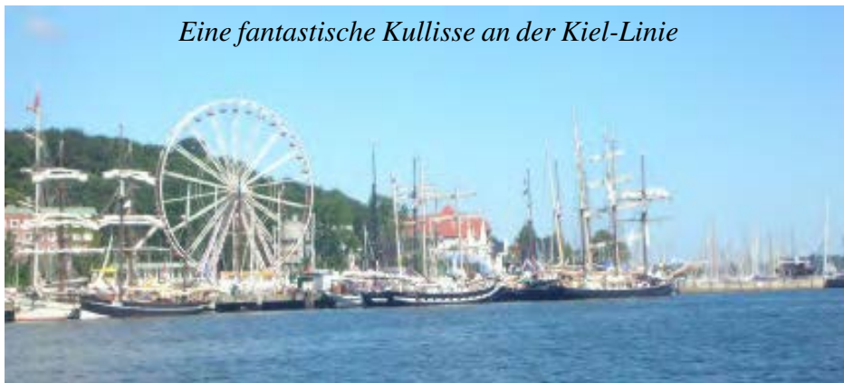
Eine fantastische Kullisse an der Kiel-Linie

Höhepunkte waren die Begegnung mit dem Seenotrettungskreuzer