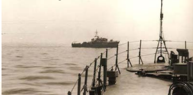
Die Jungs von der anderen Marine