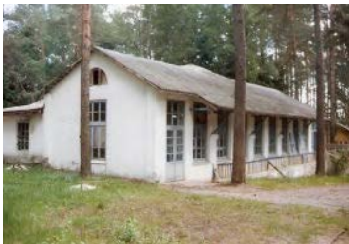
Ein Gebäude im Ferienlager „Insel der Hoffnung“ in der Nähe von Mogilev. Das Haus wird instandgesetzt. Unsere Türenspende findet gute Verwendung

Am nächsten Tag, Montag den 25.05., wieder Zollabfertigung. Auch hier verlief alles ohne Beanstandungen wenn auch mit einiger Wartezeit. Man muss nicht verstehen, warum die Überprüfung und Bearbeitung der