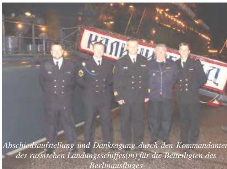
Abschiedsaufstellung und Danksagung durch den Kommandanten des russischen Landungsschiffes(m) für die Beteiligten des Berlinausfluges