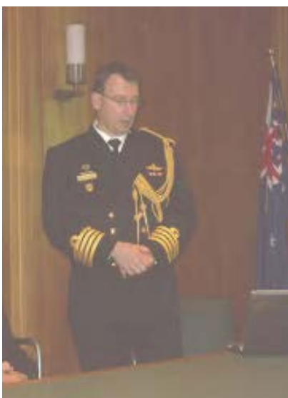
Kapitän zur See Gavin Irwin bei seinen Ausführungen

Alle Kriegsschiffe tragen als Namensbestandteil die Bezeichnung HMAS (Her Majesty's Australian Ship). Sehr interessant waren die Bilder von der HMAS Tobruk, einem Landungsschiff, das allerdings demnächst durch ein moderneres Docklandungsschiff ersetzt werden soll. Nahezu vertraut wirkten auf uns die Lenkwaffenfregatten der ANZAC-Klasse, die große Ähnlichkeiten