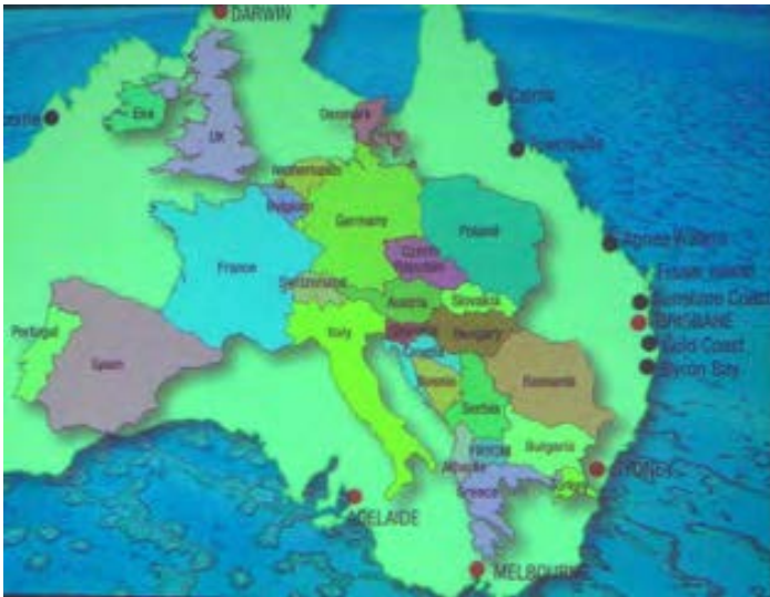
Die Landkarte zeigt den Größenvergleich zwischen Australien im Hintergrund und Europa darüber gelegt

Fregatten aufweisen. In den nächsten Jahren werden eine Reihe neuer Schiffe, aber auch Hubschrauber des Typs NH-90, in Dienst