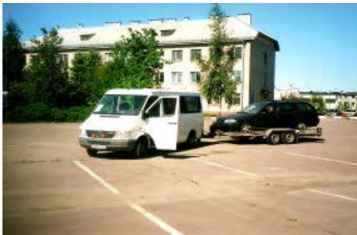
Unser Transportfahrzeug mit Trailer im Zollhof von Mogilev

bis der Motor ausfiel. Auf einer Tankstelle bekamen wir Hilfe durch einen Fremdstart. Hierzu musste ein Monteur erst telefonisch angefordert werden. Der Wagen lief