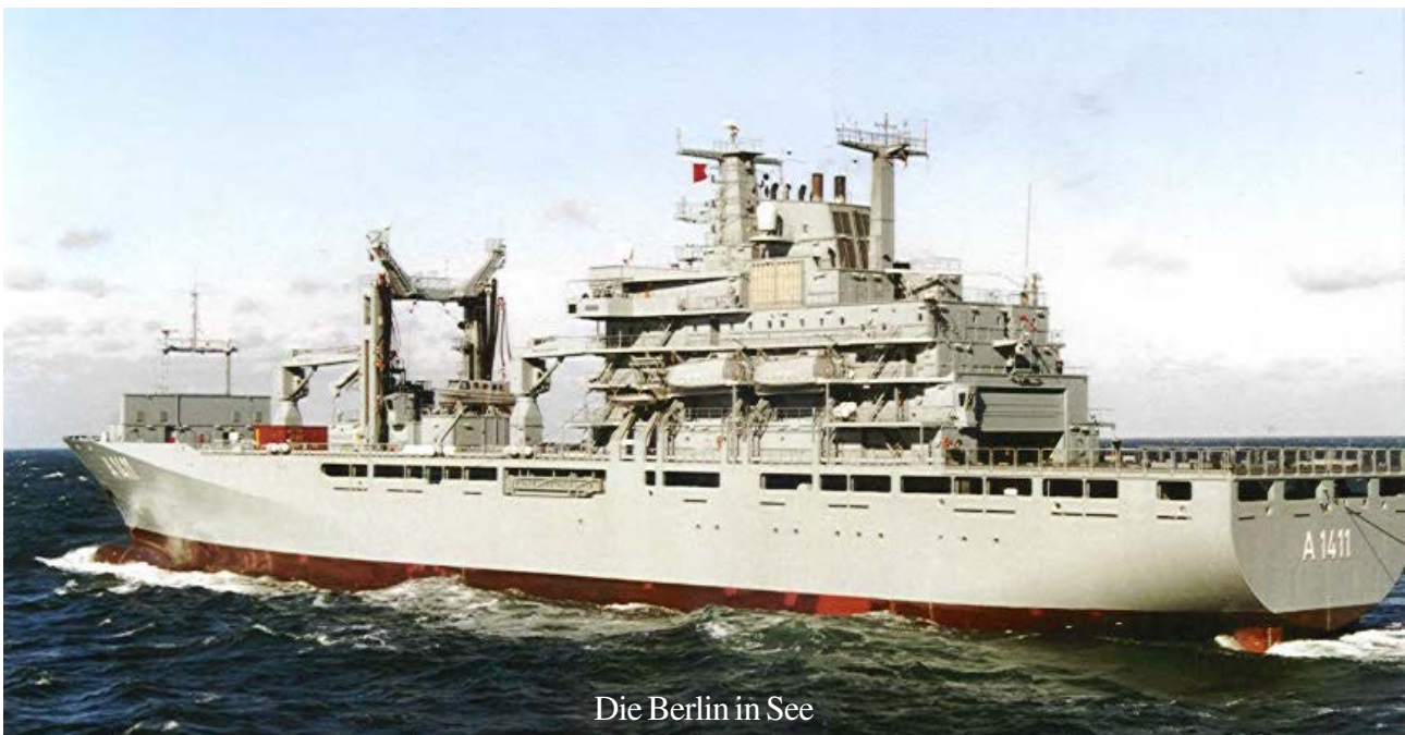
Die Berlin in See