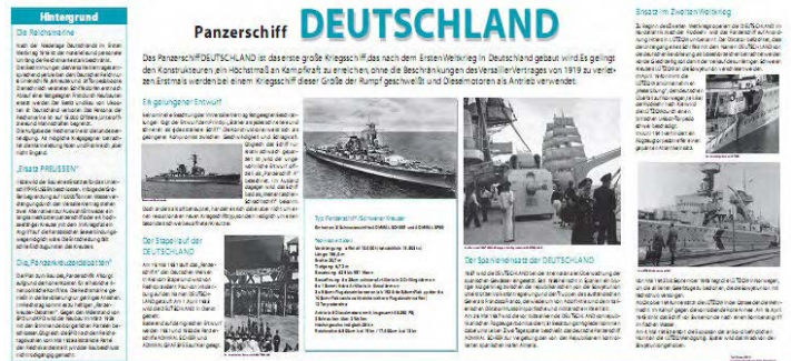
Texttafel DEUTSCHLAND – Neuer Entwurf