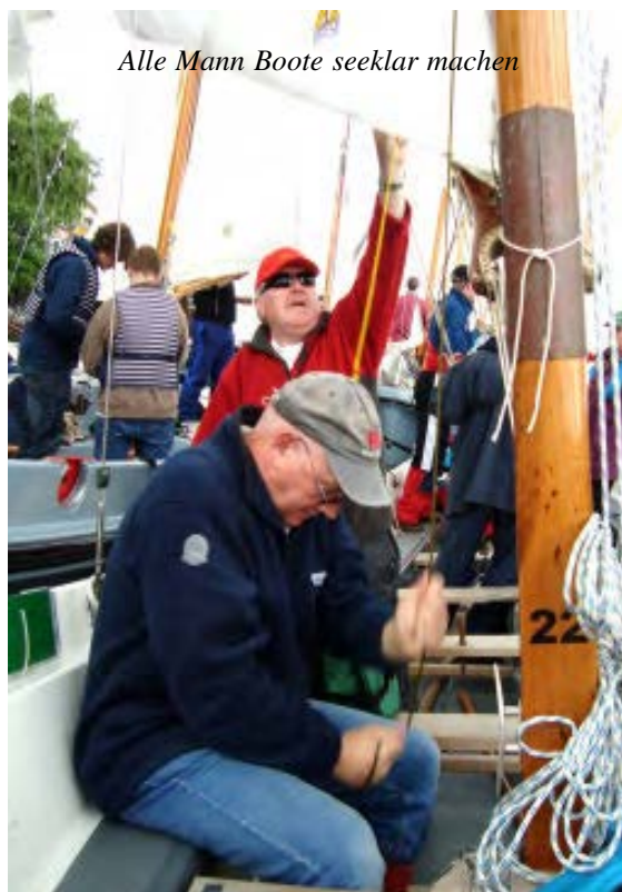
Alle Mann Boote seeklar machen

Am Samstag war schon um 05:00 Uhr wecken. Das Treffen dann um 08:00 Uhr, um die Kameraden