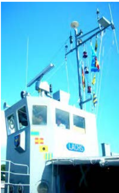
Die bunte Beflaggung der Lachs über den Brückenaufbauten

wicklungen der einzelnen MKen ausgetauscht und neue Bekanntschaften geschlossen. Fast alle sprachen nur sehr positiv über die eigene Zeit ihres Marinelebens und