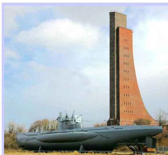
DAS MARINEEHRENMAL IN LABOE

Die Neugestaltung der Historischen Halle