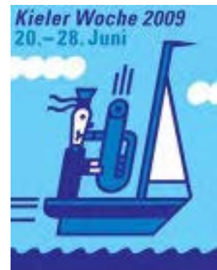
Plakat: Henning Wagenbreth

Gegen 08:30 konnte mit dem Training begonnen werden. Da die Kutter mit 9 Mann zu besetzen waren und 25 Kutter am Start waren, war es ein Gewusel erster Güte im Hafenbecken. Vorund nach jeder Regatta musste auf- und abgetakelt werden. Es wurde jeden Tag 2 Re-